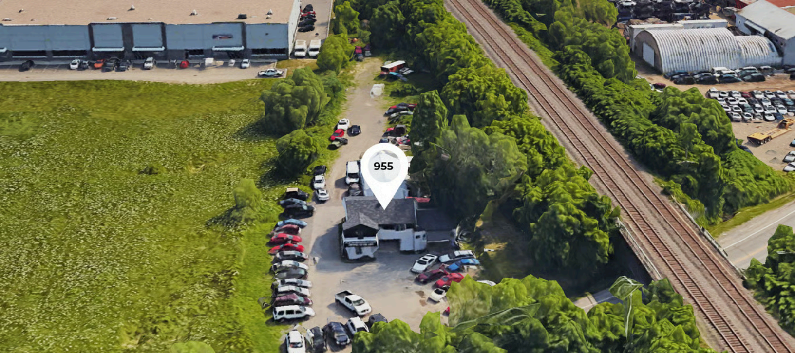
955 Route Harwood, Vaudreuil-Dorion