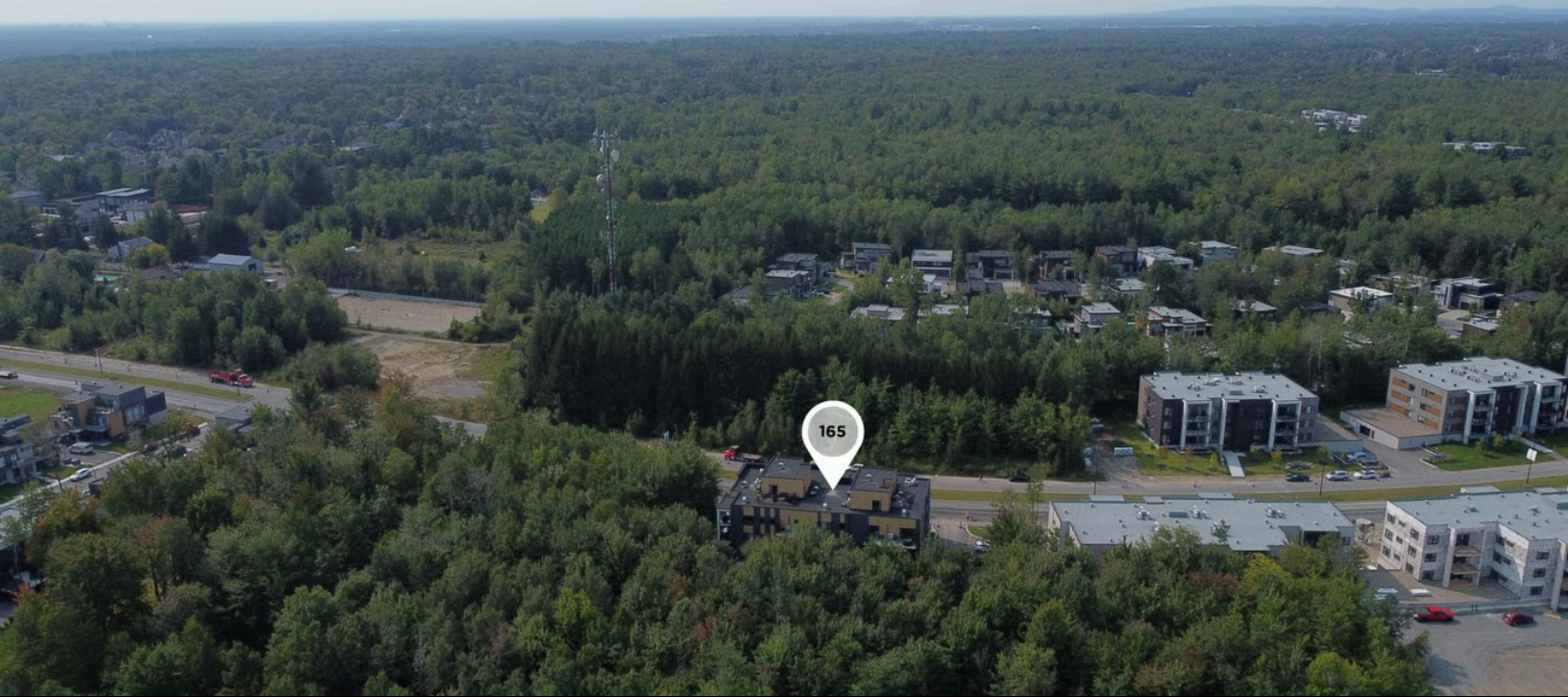
165 Boulevard Chambery, Blainville