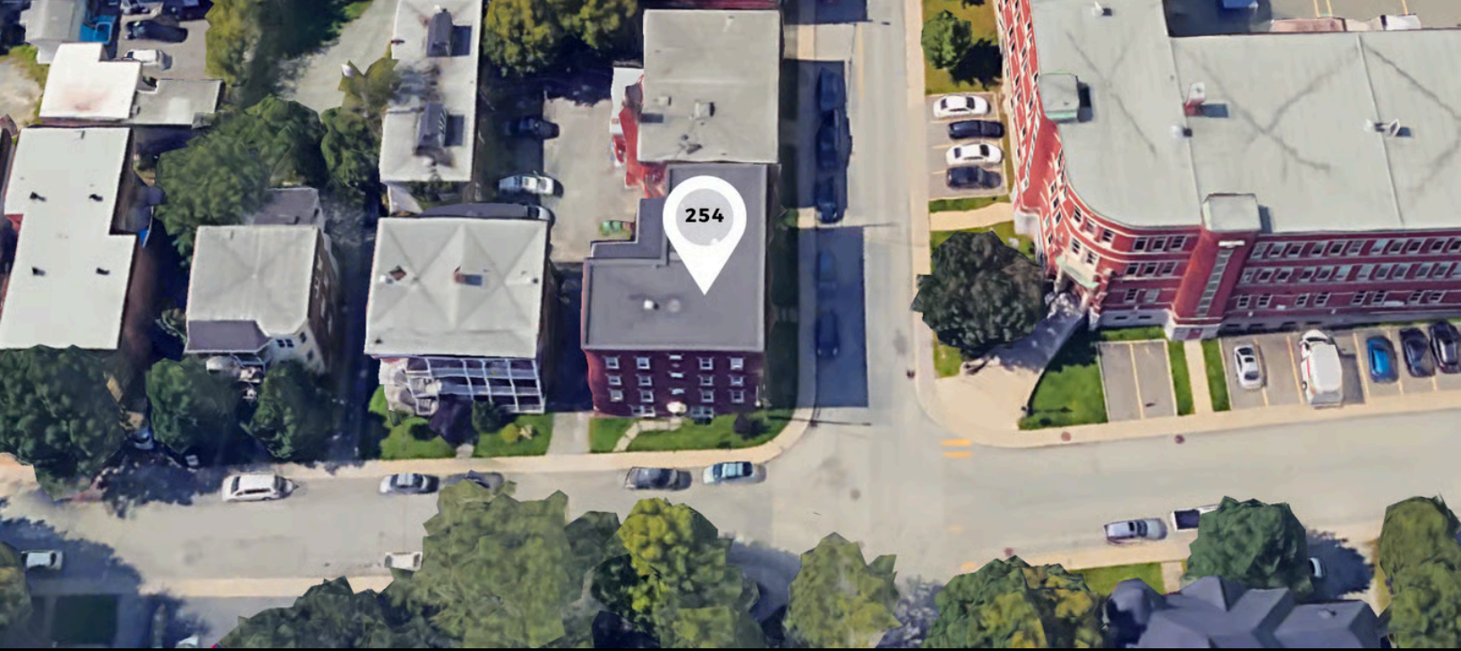
254 Ball, Mont-Bellevue