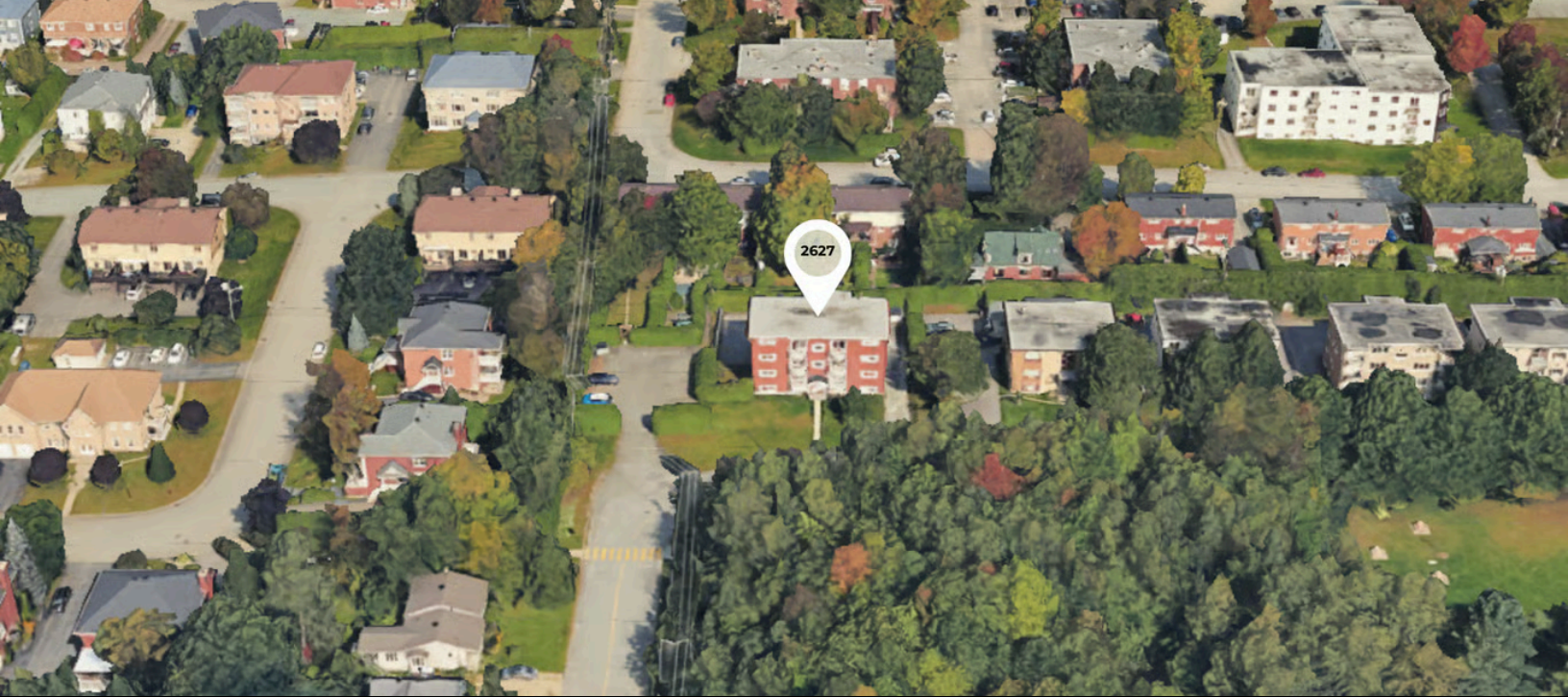
2627 De La Laurentie, Jacques-Cartier